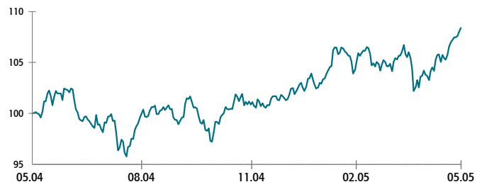
Jährliche Wertentwicklung 1 in %